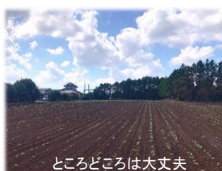
ところどころは大丈夫