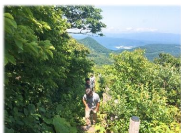
登頂目前がちょっと大変です

青森で大根を作っているのは太平洋側の下北半島、晴れている日にむつ市にある釜臥山に登ると下北半島がきれいに見ることができます。こちらは8月に行った時の写真です