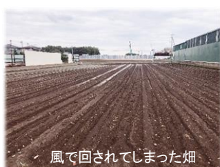
風で回されてしまった畑