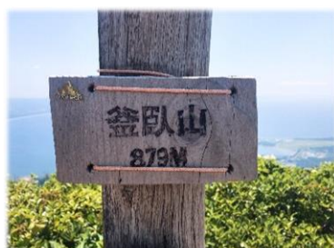
釜臥山(かまふせやま)