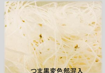
つま黒変色部混入