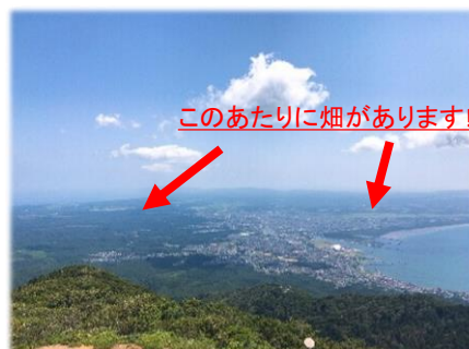
頂上からの眺め 下北半島