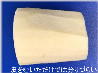
皮をむいただけでは分りづらい