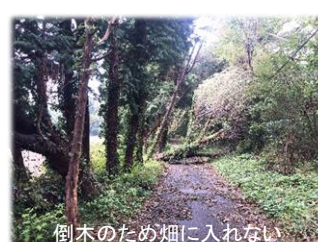
倒木のため畑に入れない

青森で大根を作っているのは太平洋側の下北半島、晴れている日にむつ市にある釜臥山に登ると下北半島がきれいに見ることができます。こちらは8月に行った時の写真です