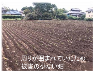
周りが囲まれていたため 被害の少ない畑

また通常10月いっぱいまで青森での収穫作業が続きますが、千葉から青森へのつながりを心配して昨年より2ha増の合計4ha(約260t以上)多く作付けをしています。今期は予備で作付けした4ha分を全て収穫することになりそうですので青森での収穫作業が11月上旬ごろまでになりそうです。