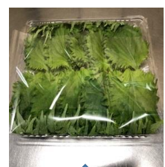
シートに包まれています