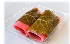
昨年いただいた桜もち

さて、最後に3月といえば3月3日のひな祭り。じつは毎年弊社の事務スタッフが昔から「桜もち」を作ってくれるんです。毎年いただくのですっかりあの美味しい味がインプットされましたが、色合いもきれいでおいしいんですね。皆さんも頂き物を、決まった方から決まった物を頂くことも結構あると思います。昔のきおくですが叔母宛にヨックモックのシガールをもってきてくれる人がいましてそのシガールをたまに叔母がくれたんですが、それはもう美味しくって、、それからシガールを見るとその時の事だったり、時間も味も思い出して、、そういうお菓子はすごいですね。さて今年はまだ「桜もち」が頂けるのかたのしみです。