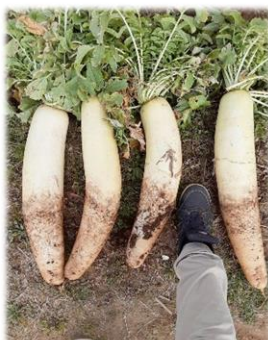
葉が旺盛で重みに耐えきれず根が曲がってしまう