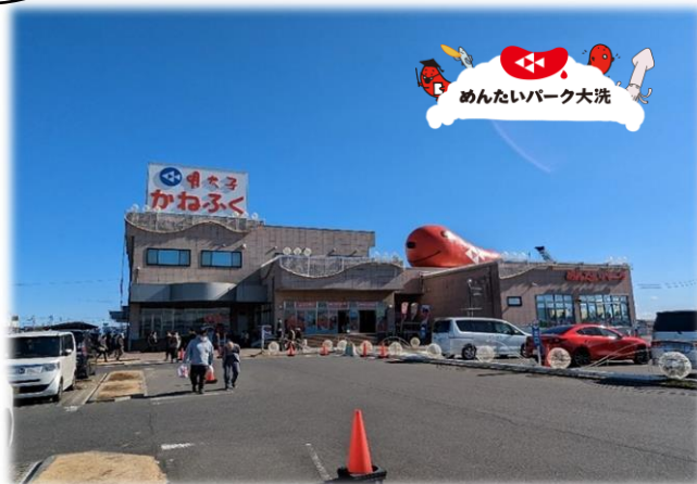
明太パーク大洗に行ってきました

こんにちは、営業の矢野です。 さてご飯のお供といえば何が思いつくでしょうか...。私はやっぱり明太子が1番かなと思います！そんなご飯のお供、明太子のテーマパークを知っていますか？ 明太子のかねふくが運営する「めんたいパーク」です。大洗、とこなめ、神戸三田、伊豆、びわ湖、群馬の6か所ありますが、先日は大洗のめんたいパークへ行きました(^^)/ 明太子がたっぷり入った大きなおにぎりを食べたり、できたての明太子を購入しましたが、結構混雑していて明太子の人気ぶりを感じました。買って来た明太子でご飯がすすんでつい食べ過ぎてしまいます。