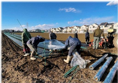
種を播いた後あとすぐにビニールをかけます