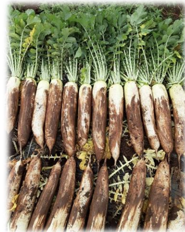
3月中旬播き 信じられない大根